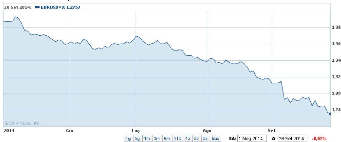
Il cambio euro/dollaro

A partire da maggio di quest'anno, l'euro ha incominciato una lenta discesa nei confronti del dollaro sulla spinta combinata degli annunci di politica monetaria della Banca Centrale Europea e delle azioni della Federal Reserve degli Stati Uniti. Quest'ultima sta mettendo in atto il cosiddetto "tapering", ovvero la graduale riduzione degli acquisti di titoli dai mercati finanziari mentre da Francoforte arrivano segnali nella direzione opposta, con l'annuncio di un – seppure limitato – Quantitative Easing a partire da ottobre. La politica meno espansiva della Fed induce così i capitali a rientrare, nell'attesa di un rialzo dei tassi, cosa che tende ad apprezzare la divisa americana. Il processo opposto avviene, e ancor più avverrà quando il mini-QE inizierà per davvero, dal nostro lato dell'Oceano. Il presagio della "staffetta" tra le due banche centrali è bastato a svalutare l'euro di 8 punti percentuali da maggio ad oggi. Non molto, ma l'accelerazione di inizio settembre, a seguito dell'annuncio del QE da parte di Mario Draghi, fa ben sperare per una svalutazione più consistente.