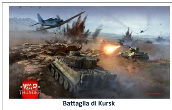
Battaglia di Kursk

La sconfitta dei nazi-fascisti a Stalingrado ridiede fiducia e slancio all'offensiva dei sovietici, i quali dopo alcuni mesi riportarono un'altra formidabile vittoria nella battaglia di Kursk (5-16 luglio 1943), il più grande scontro di carri armati della Storia.