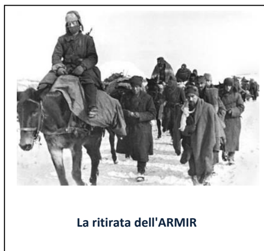
La ritirata dell'ARMIR

Se questo è successo una volta potrà tornare a succedere. Potrà succedere, voglio dire, a innumerevoli altri uomini e diventare un costume, un modo di vivere... »