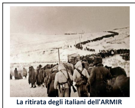
La ritirata degli italiani dell'ARMIR

In quell'inverno del 1942-3, nel bacino del Don, tragica fu la sorte dell'armata italiana dell'ARMIR: dei 230.000 soldati inviati da Mussolini in Russia, 100.000 non fecero più ritorno in Italia. Ma molti di quelli che fecero ritorno lasciarono viva testimonianza dell'ospitalità e dell'aiuto che le famiglie sovietiche diedero loro durante la ritirata. Basta citare, per tutte, quella di Mario Rigoni Stern ( Il sergente nella neve ).