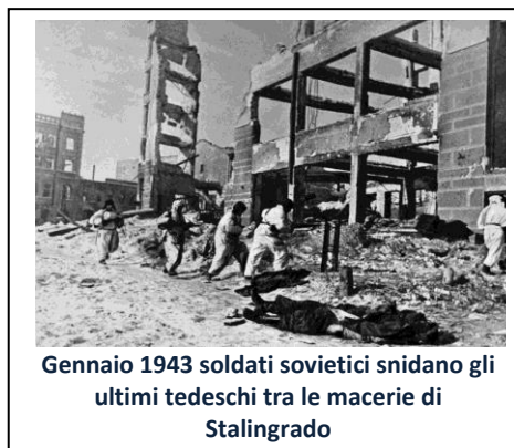
Gennaio 1943 soldati sovietici snidano gli ultimi tedeschi tra le macerie di Stalingrado

Stalingrado, dunque: la battaglia che dura 200 giorni (17 luglio 1942 – 2 febbraio 1943) e che mette in campo oltre 3 milioni di uomini e uno dei più grandi armamentari offensivi della Storia; la battaglia che si combatte con la tecnologia più avanzata, ma anche con uno scontro epico sul terreno: strada per strada, palazzo per palazzo, scantinato per scantinato; la battaglia durante la quale i sovietici riescono a capovolgere la situazione, trasformandosi da assediati in assedianti; lo scontro mortale, alla fine del quale l'Armata rossa sovietica infligge alle armate nazi-fasciste una sconfitta colossale (perdita di 800.000 uomini, tra morti, prigionieri e dispersi).