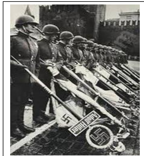
Mosca: bandiere naziste nella polvere dopo la sconfitta

protagonista di una dittatura economica che non ha riguardo per i Paesi più deboli dell'UE, in contrasto con la generosità che la comunità internazionale ha usato verso di essa in relazione alle riparazioni di guerra e ai problemi della riunificazione tedesca.