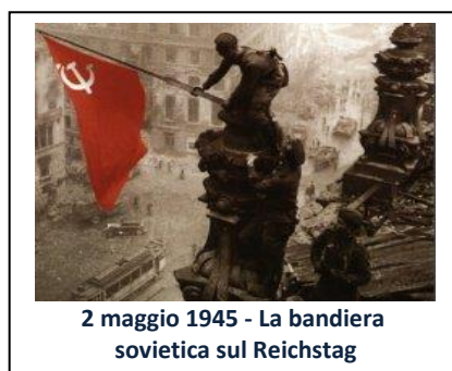
2 maggio 1945 - La bandiera sovietica sul Reichstag

Da Stalingrado e da Kursk iniziava l'inesorabile avanzata dei sovietici per liberare tutti i territori occupati dai nazisti; avanzata che ridava speranza ai prigionieri dei campi di concentramento (come ricorda Primo Levi ne La tregua ) e che si sarebbe conclusa a Berlino nel 1945.