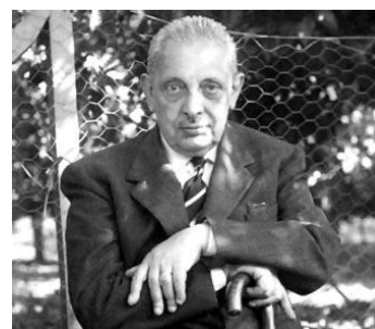
Giuseppe Tomasi di Lampedusa

Nel sessantesimo anniversario della prima stesura del "Gattopardo" (1955-1956), dedichiamo questo dossier al romanzo che, dopo una vicenda editoriale travagliata, è stato riconosciuto come il più importante del Novecento italiano.