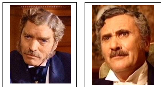
Il Principe (Burt Lancaster) e Don Calogero (Paolo Stoppa) nel film di Visconti (1963).

Sarebbe ardito affermare che don Calogero approfittasse subito di quanto aveva appreso; egli seppe da allora in poi radersi un po' meglio e spaventarsi meno della quantità di sapone adoperato nel bucato, e null'altro; ma fu da quel momento che si iniziò, per lui ed i suoi, quel costante raffinarsi di una classe che nel corso di tre generazioni trasforma efficienti cafoni in gentiluomini indifesi.»