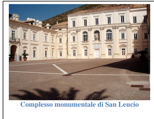
Complesso monumentale di San Leucio

Tutti questi aspetti rendono pienamente condivisibile il giudizio di Anna Maria Rao: «La regia manifattura della seta installata a S. Leucio fu accompagnata da una legislazione sociale di tutela della locale comunità di artigiani, che venne salutata come una delle più piene manifestazioni dell' assolutismo illuminato».