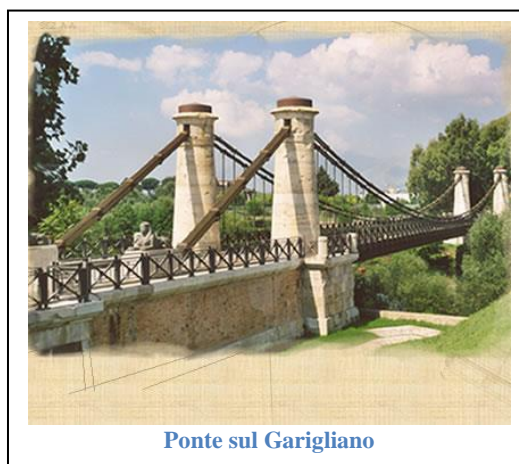
Ponte sul Garigliano

Sviluppata era l'industria edilizia, fin dai tempi di Carlo di Borbone, quando l'impresa Carasale era riuscita a costruire il Reale teatro San Carlo in meno di nove mesi. Ma poi (tra il 1850 e il 1860) i record sarebbero stati ripetuti con altre opere grandiose: i ponti muratura sul Fortore (13 arcate) e sul Biferno (5 arcate), il Corso Maria Teresa a Napoli (5 km.), i lavori sul Sarno, il bacino di carenaggio in muratura nell'Arsenale di Napoli, la costruzione di ben 27 ospedali civili, le bonifiche delle paludi, la creazione dei Regi Laghi , ecc.