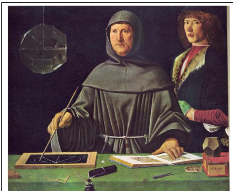
Luca Pacioli nella sua "Summa de arithmetica, geometria, proportioni e proportionalità" (1464) fornì una descrizione accurata della partita doppia, già in uso in Italia dalla fine del XIII secolo.

(A.Barbagallo, dal Calendario del Popolo n. 731 giugno 2008)